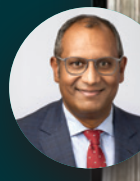
HENSLEY MOOROVEN (Français) Sous-secrétaire de la Conférence générale