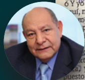
ALEJANDRO BULLÓN (Espagnol) Évangéliste à la retraite