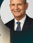
TED N. C. WILSON Président de la Conférence générale